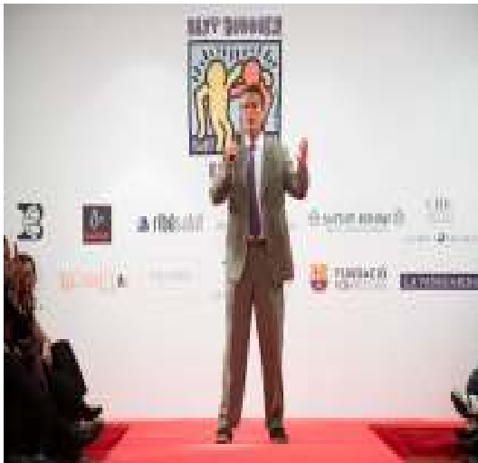
Anthony Kennedy apoyando con su presencia nuestro desfile solidario en Barcelona

Actualmente nuestros programas se están desarrollando en diferentes ciudades de España, tales como Madrid, donde se encuentra la sede, Barcelona y Salamanca.